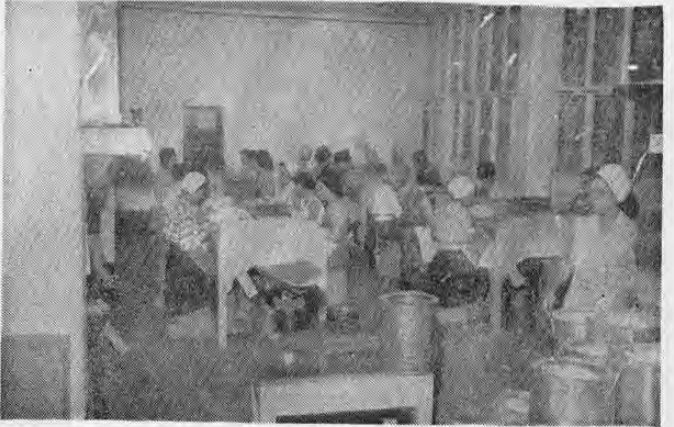
MÁS DE CUATROCIENTOS EMPLEADOS, en su mayoría mujeres, trabajan en "El Gallito Industrial" que inunda con sus productos de prim- erísima calidad todos los mercados de Centro América. Esta es una visita parcial de una de las secciones de empaque.