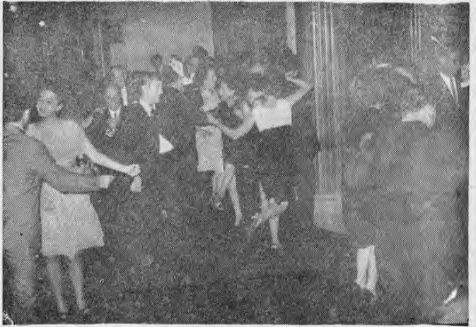
Un aspecto del grandioso baile.