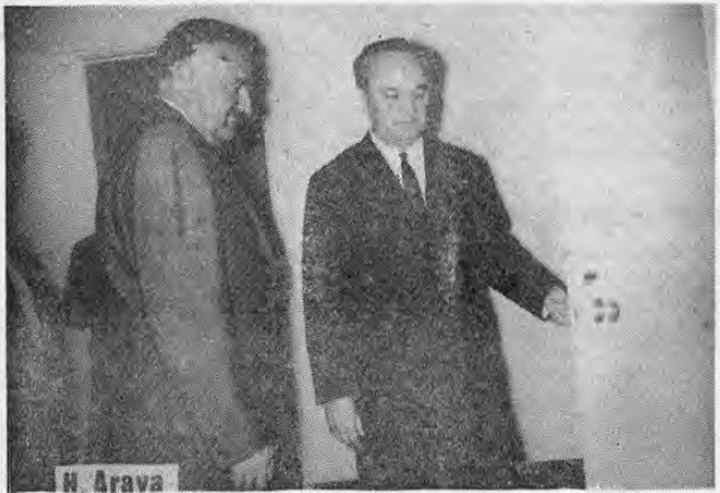
El Sr. Presidente de la República, profesor Trejos Fernández, recibió al Ex-Presidente del Ecuador, Dr. Galo Plaza. La conversación fue a puerta