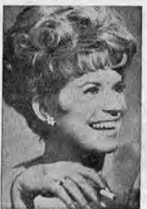
... Y hasta la próxima...

—Y para que los lectores la conozcan, incluimos su fotografía. No la pierdan de vista, y lénganla presente cuando se exhiba "La Vida... y como vivirla".