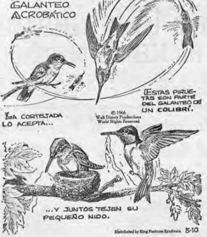
...Y JUNTOS TEJEN SU PEQUEÑO NIDO.